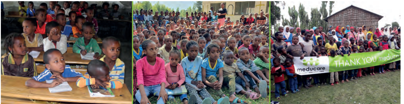
Projekt: MC206 Äthiopien Bildungsprojekt für Vorschul- und Grundschul Kinder