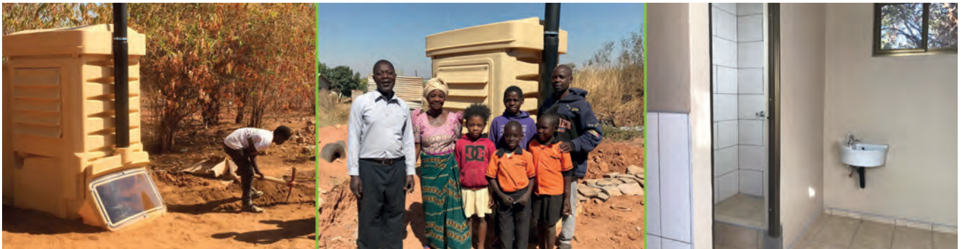
Projekt: MC007 Sanitation / Sani Solar