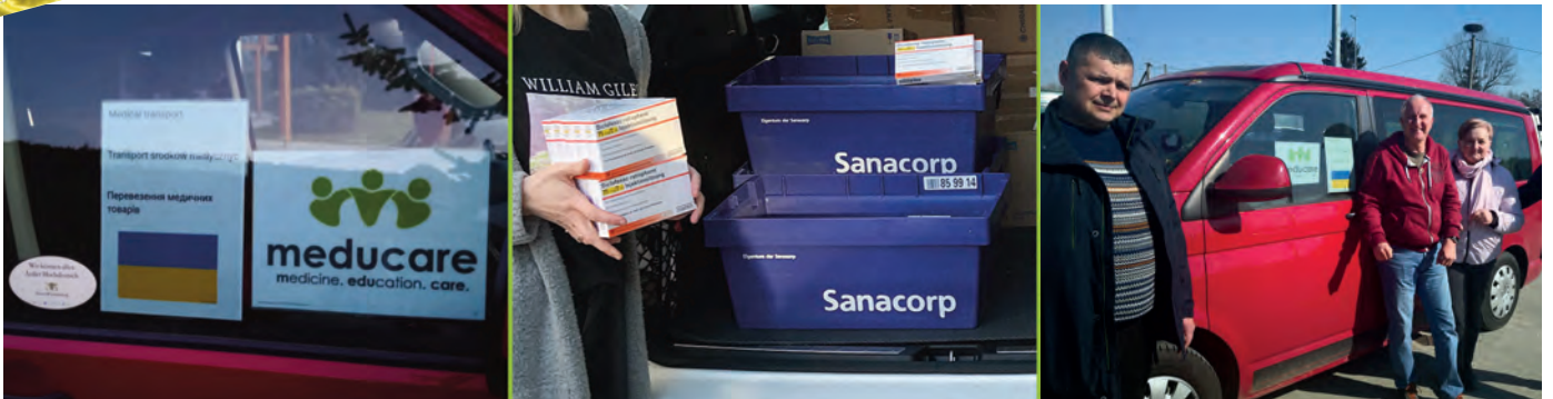
Projekt: MC232 Nothilfe: Ukraine (Medizin)