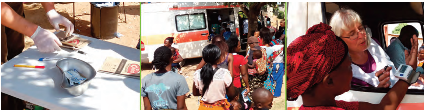
Projekt: MC015 Sambia Mobile Klinik