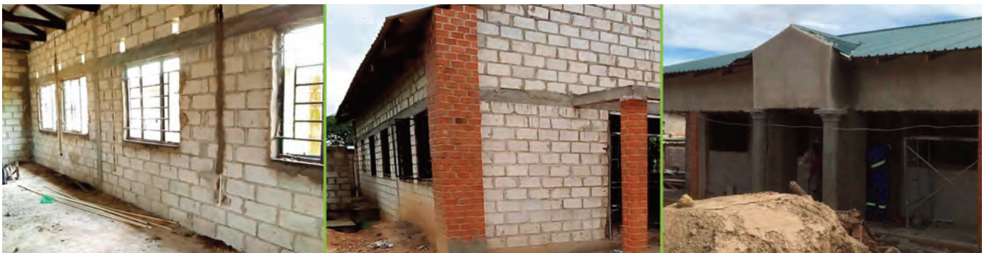
Projekt: MC011 Sambia Bauleni Schulprojekt