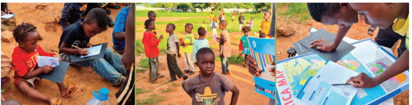
Projekt: MC247 Sambia Kids-Clubs / Projekte für Kinder