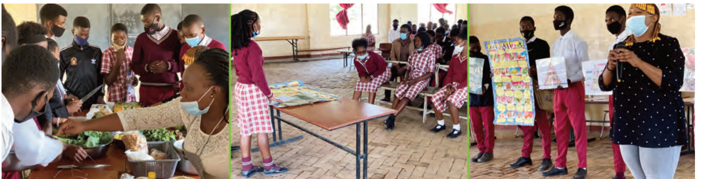
Projekt: MC013 Sambia Gesundheitsprojekt für HIV-negative Kinder