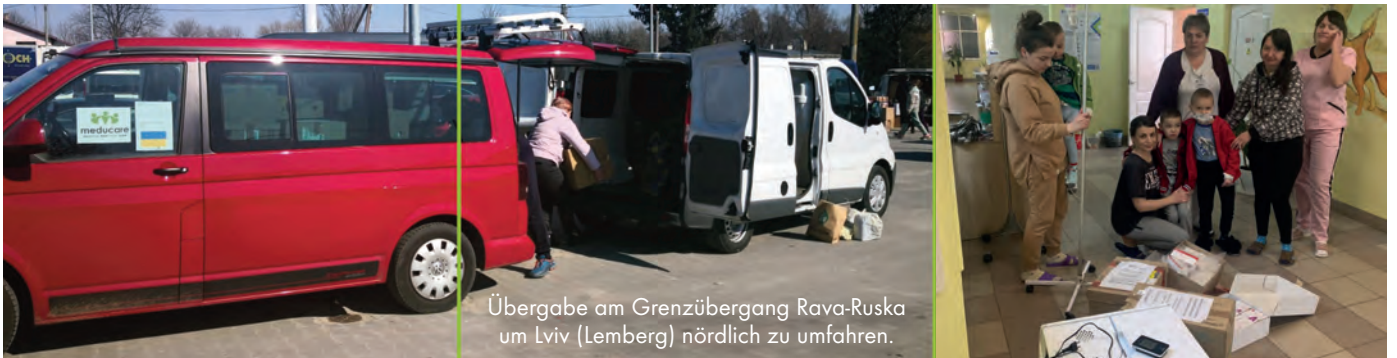
Projekt: MC232 Nothilfe: Ukraine (Medizin)